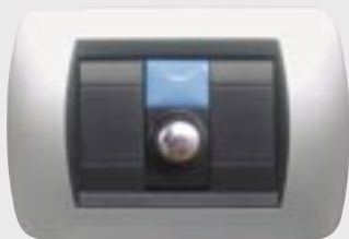
POTENZA APPLICABILE 100% DATI DI TARGA

In scatole da incasso 506 / 507 max 750W (carico resistivo) max 450W (carico induttivo)