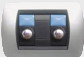
POTENZA APPLICABILE max 2x250W CARICO RESISTIVO max 2x150W CARICO INDUTTIVO