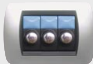
POTENZA APPLICABILE max 3x160W CARICO RESISTIVO max 3x100W CARICO INDUTTIVO

Sempre e comunque sarà possibile inserire solo un massimo di 3 regolatori per scatola